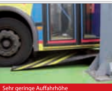
Sehr geringe Auffahrhöhe